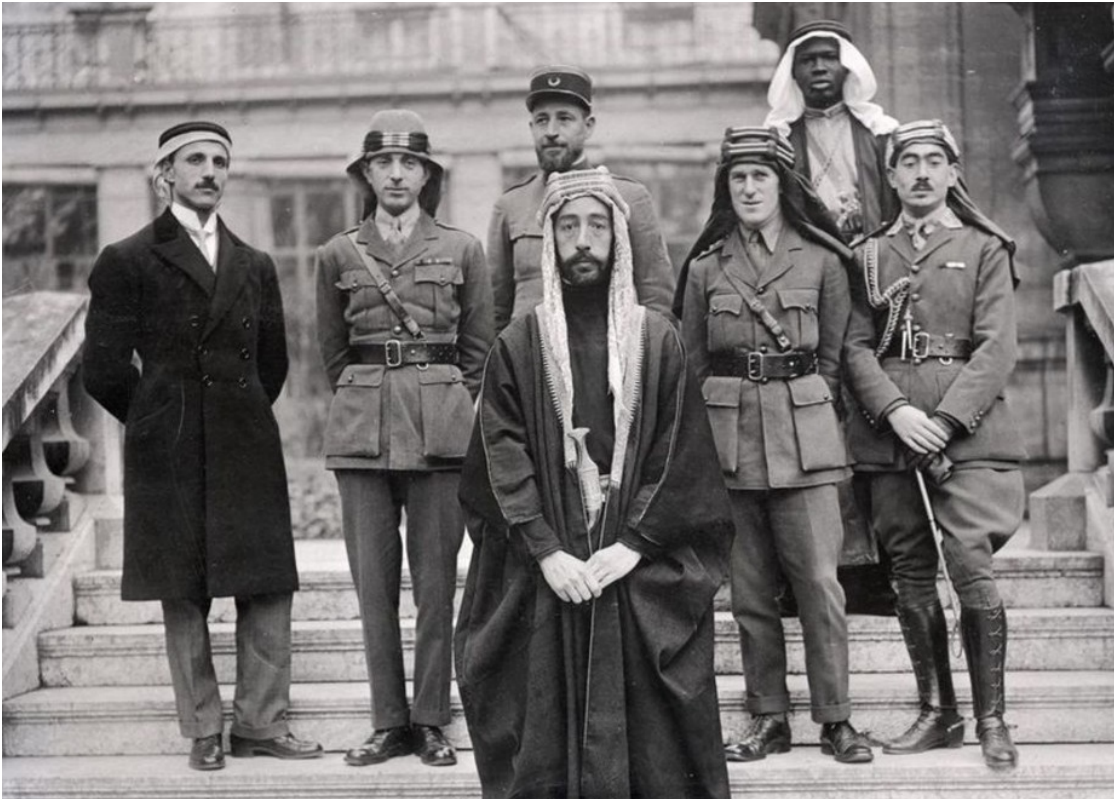
Король Фейсал с членами своего кабинета (второй справа во втором ряду - Лоуренс Аравийский) в Версале, 1919

стремилось обеспечить защиту Суэцкого канала и получить арабскую нефть — в этом британцы оказались дальновиднее французов. Более того, Британия нуждалась в транспортном коридоре от Египта до только что обнаруженных нефтяных месторождений в Мосуле. Сионистская идея получила поддержку определенных кругов в Британии, поскольку могла послужить освоению пустынного пространства между крайними точками британских владений. Так или иначе, но в Британский мандат на Палестину, фиксировавший границы еврейского национального дома, вошла позднее вся территория нынешней Иордании и Израиля.