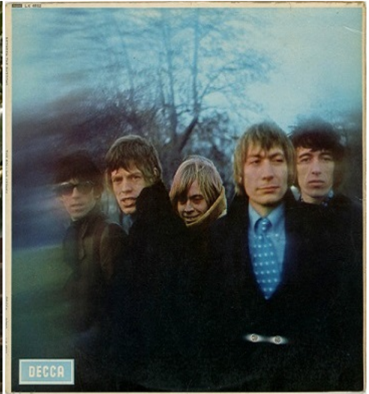
Обкладинка альбому Between the Buttons

Помітну роль в успіхах групи зіграв і Геред Манковіч — зовсім молодий, але вже модний фотограф, залучений Олдемом до роботи з групою. Саме Манковіч — автор знімків, які зробили групу візуально впізнаваною, він оформляв перші її альбоми й був офіційним фотографом, котрий супроводжував The Rolling Stones під час турне по США в 1965 році. Фото Манковіча для обкладинки альбому 1967 року Between the Buttons увійшло в історію, як і його знімки Джиммі Хендрікса, Елтона Джона та інших зірок рок-музики.