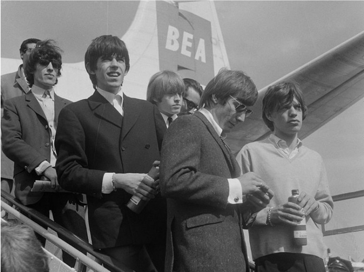
The Rolling Stones в аэропорту Амстердама, 1964

Важко знайти людину, навіть далеку від рок-музики, яка б не чула про The Beatles і The Rolling Stones. Ключову роль у сходженні ліверпульської четвірки до світової слави зіграв нащадок литовських і російських євреїв Брайан Епштейн. Цю людину навіть називали «п'ятим бітлом». Саме він розробив сценічний імідж The Beatles, організував запис їх першого альбому й численні гастролі. Якби не смерть від передозування снодійного в 32 роки, Епштейн відкрив би ще чимало талантів.